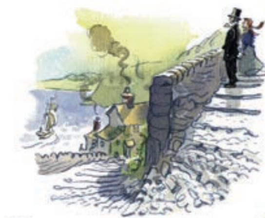
La plaque commémorative du 175 e anniversaire de la Société des Marins Naufragés se trouve au bout du quai (23).

Vous en apprendrez plus en vous rendant au cottage du pêcheur (Fisherman's Cottage) (9). Pour les sorties de pêche, renseignez-vous au centre d'accueil.